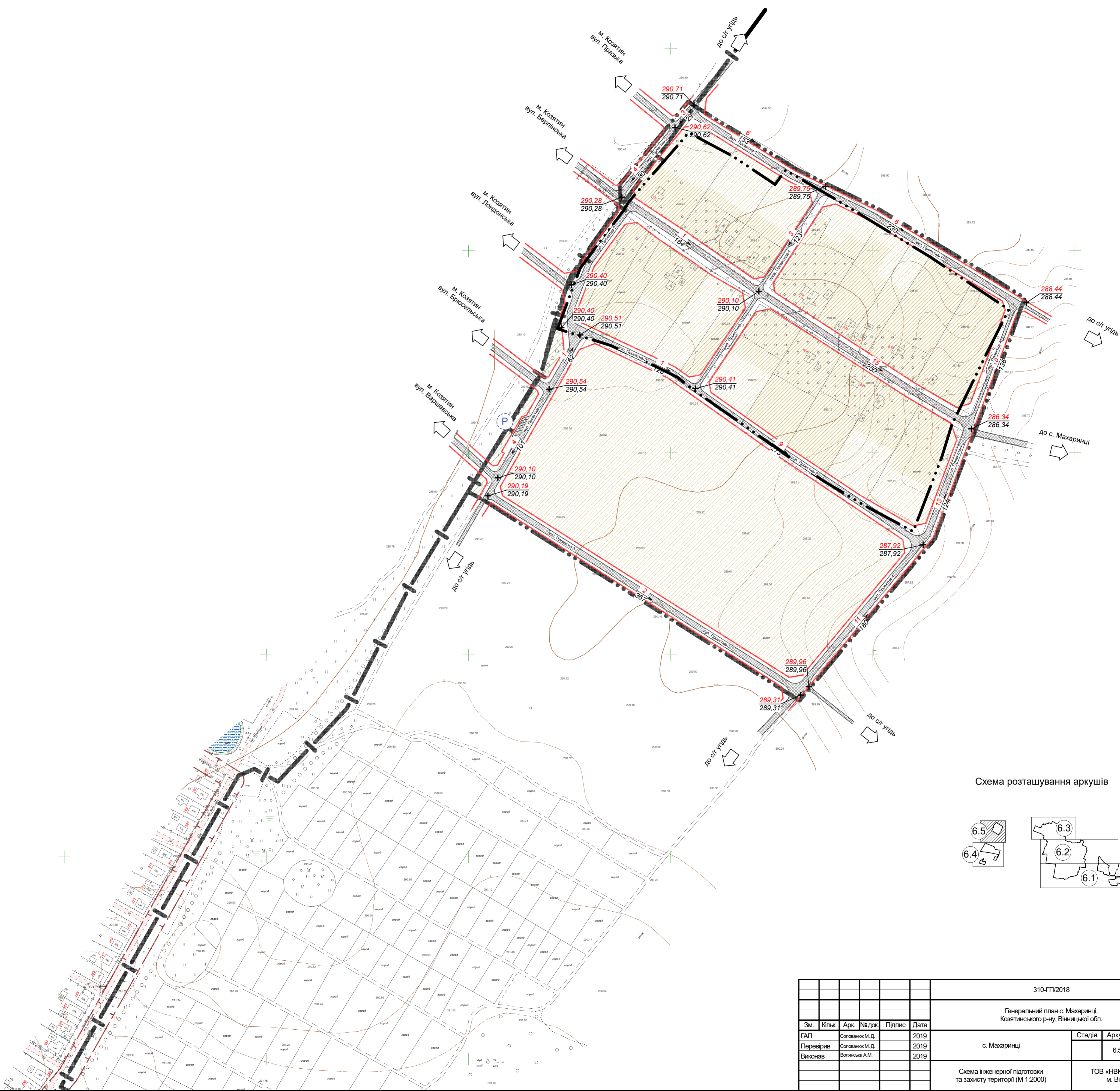
Схема розташування аркушів