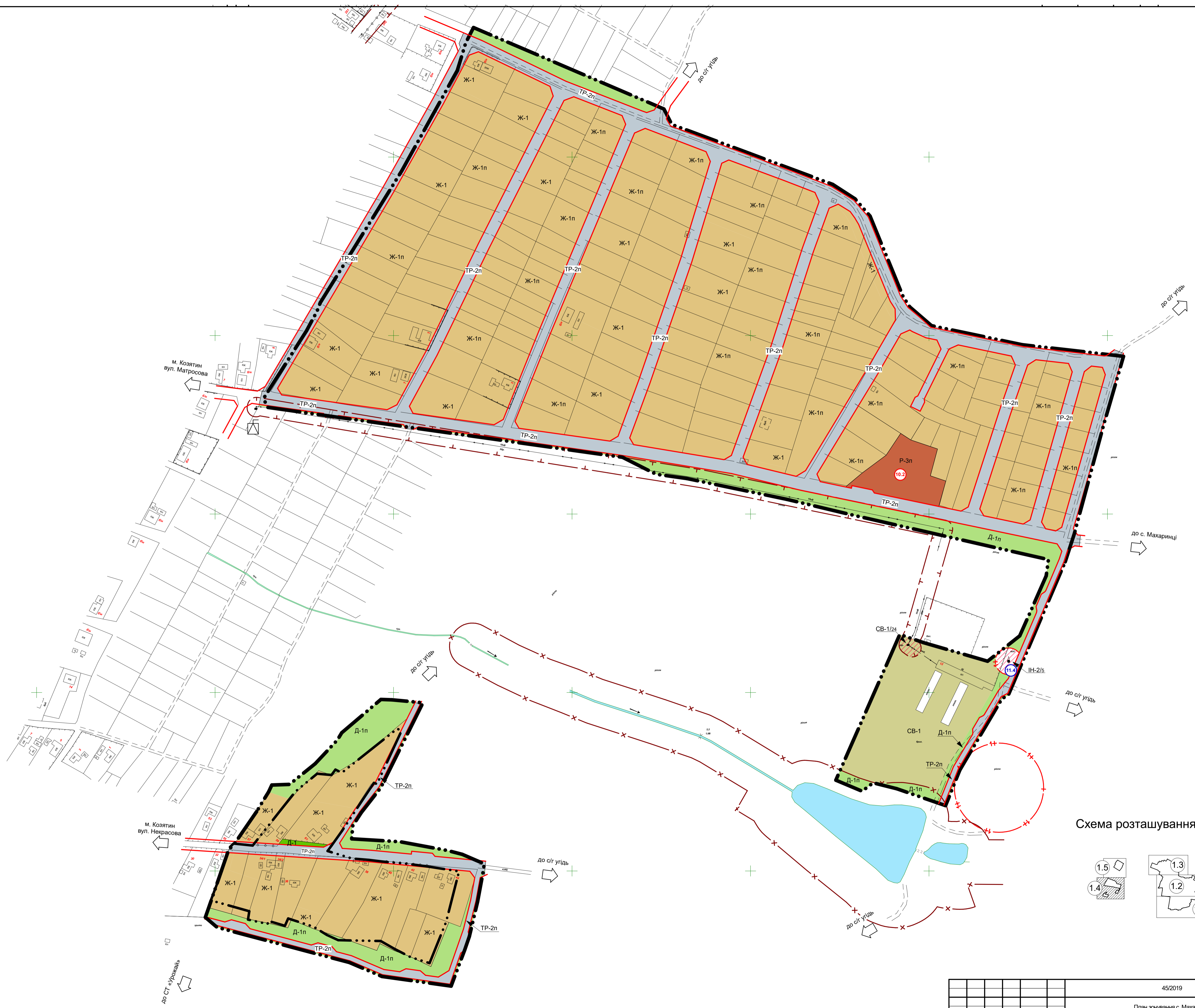
Схема розташування аркушів